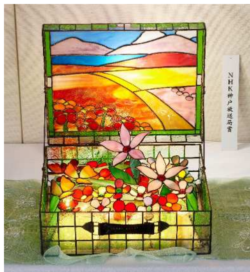
賞名：NHK 神戸放送局賞 受賞者名：栗村 マヤ子 題名：思い出トランク 部門：工芸II