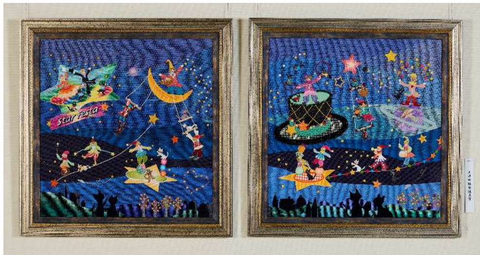
賞名：兵庫県議会議長賞 受賞者名：(一社)戸塚刺しゅう協会 題名：星空のサーカス 部門：糸工芸