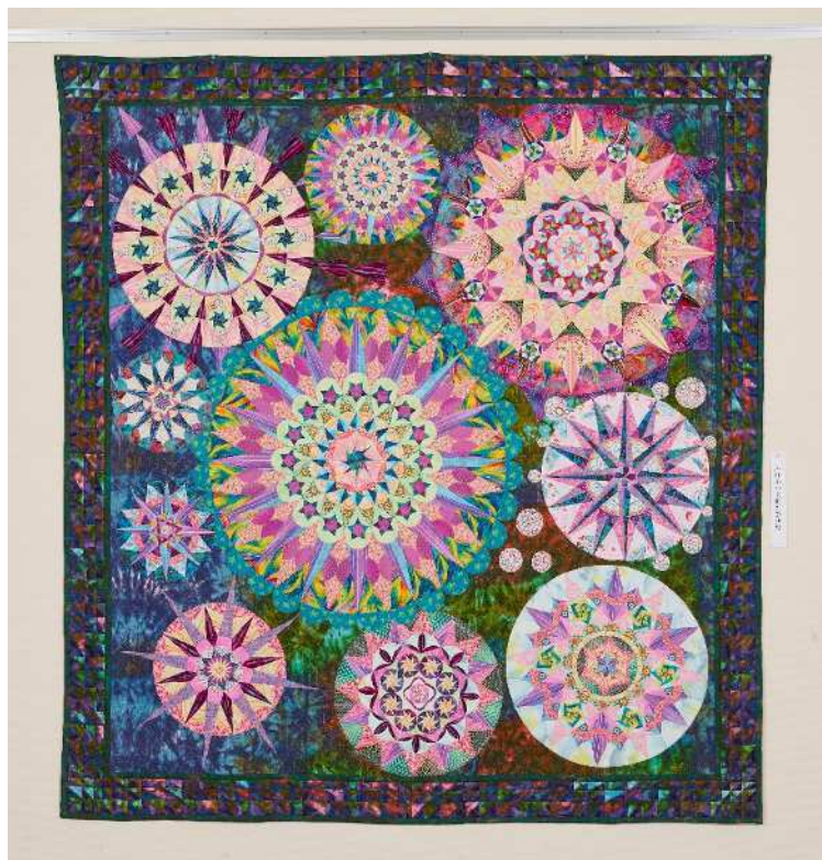
賞名：ふれあい文化の祭典賞 受賞者名：渡邊 美代子 題名：のぞいて！のぞいて！万華鏡 部門：布工芸