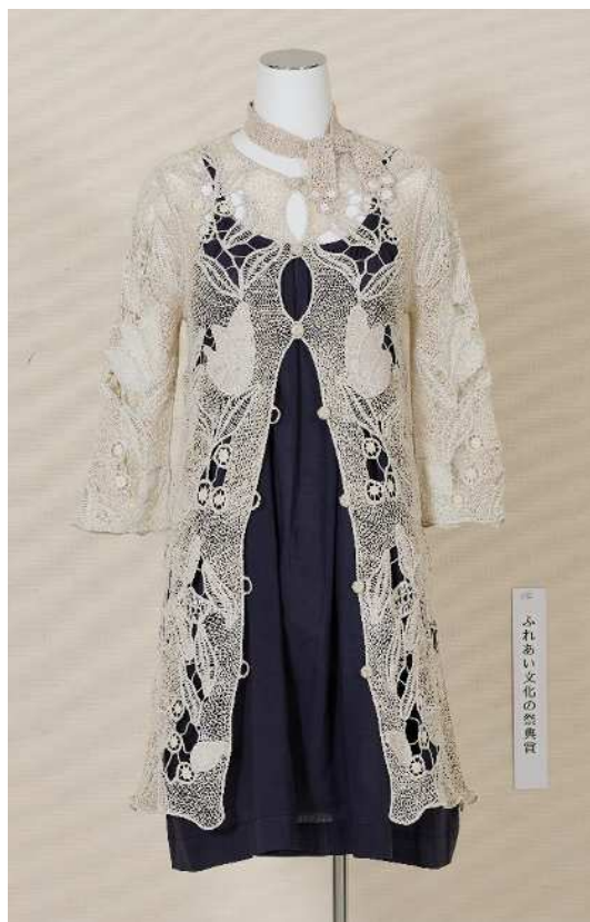
賞名：ふれあい文化の祭典賞 受賞者名：中村 まどか 題名：レースのコートドレス 部門：糸工芸