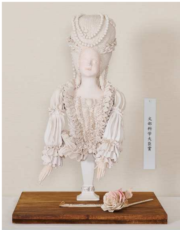
賞名：文部科学大臣賞 受賞者名：柘植 朝子 題名：マリー・アントワネット 部門：工芸 I