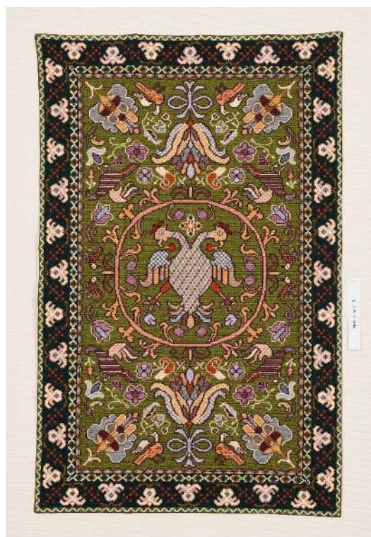
賞名：サンテレビ賞 受賞者名：護法 薫 題名：Galo de duas cabeças 部門：糸工芸