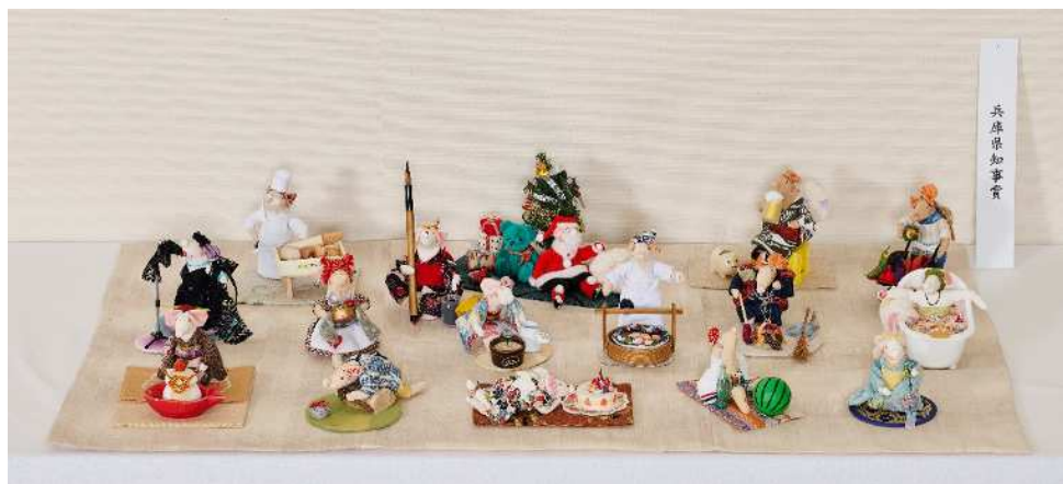
賞名：兵庫県知事賞 受賞者名：谷口 幸子 題名：百均グッズとコラボです。和布 部門：布工芸