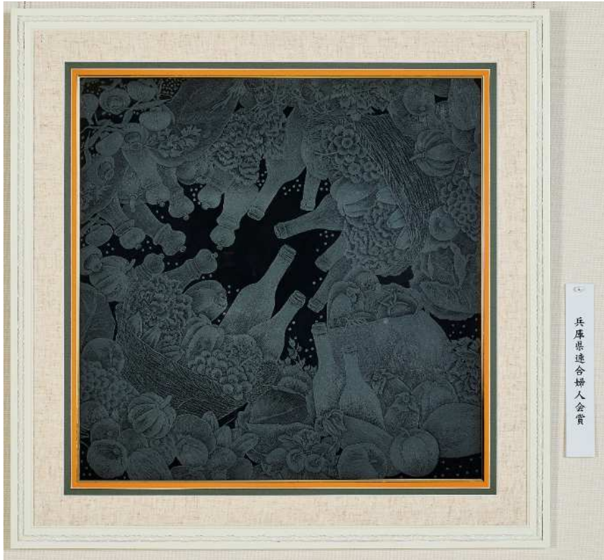
兵庫県連合婦人会賞